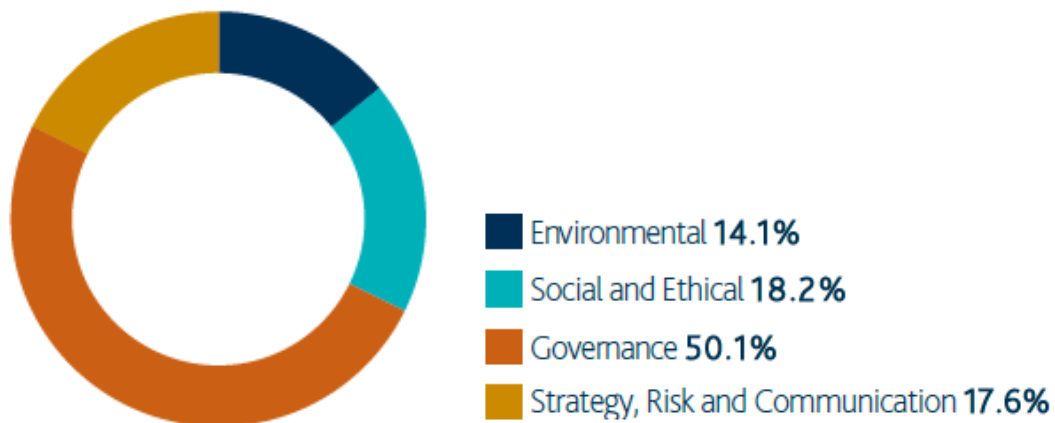
Verdeling van engagement thema's per ultimo Q2 2017

dialogoog aangegaan op het gebied van werknemersrechten en bij 121 bedrijven is de beloning van het bestuur aangekaart.